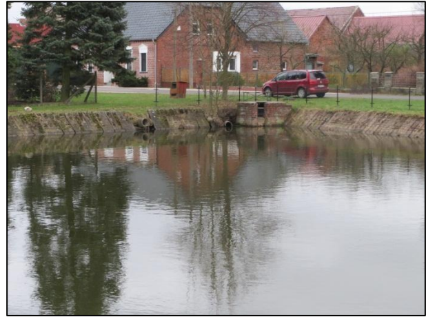
Bauphase am Dorfteiches Zeckerin im Winter 2016/17