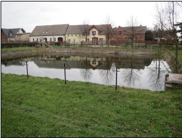
Zustand des Dorfteiches Zeckerin 2015

Die Umsetzung der Maßnahme hat im Herbst 2016 begonnen.