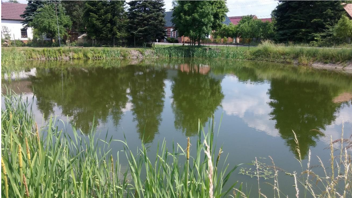
Der Dorfteich kurz nach der Renaturierung.