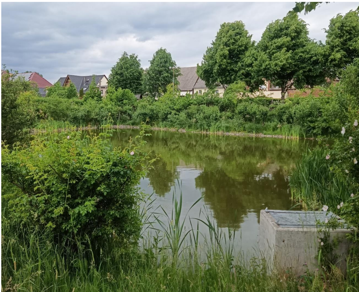
Naturnah eingegrünter Dorfteich mit Quelle nach fünf Jahren (Mai 2022)

Weiterführende Informationen können Sie bei Bedarf unter unten angegebener Adresse erhalten.