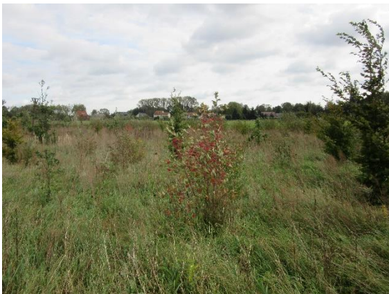
Naturnahe Waldentwicklung über Initialpflanzung