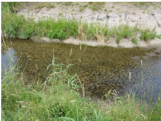
Sortierung in kiesige und sandige Abschnitte