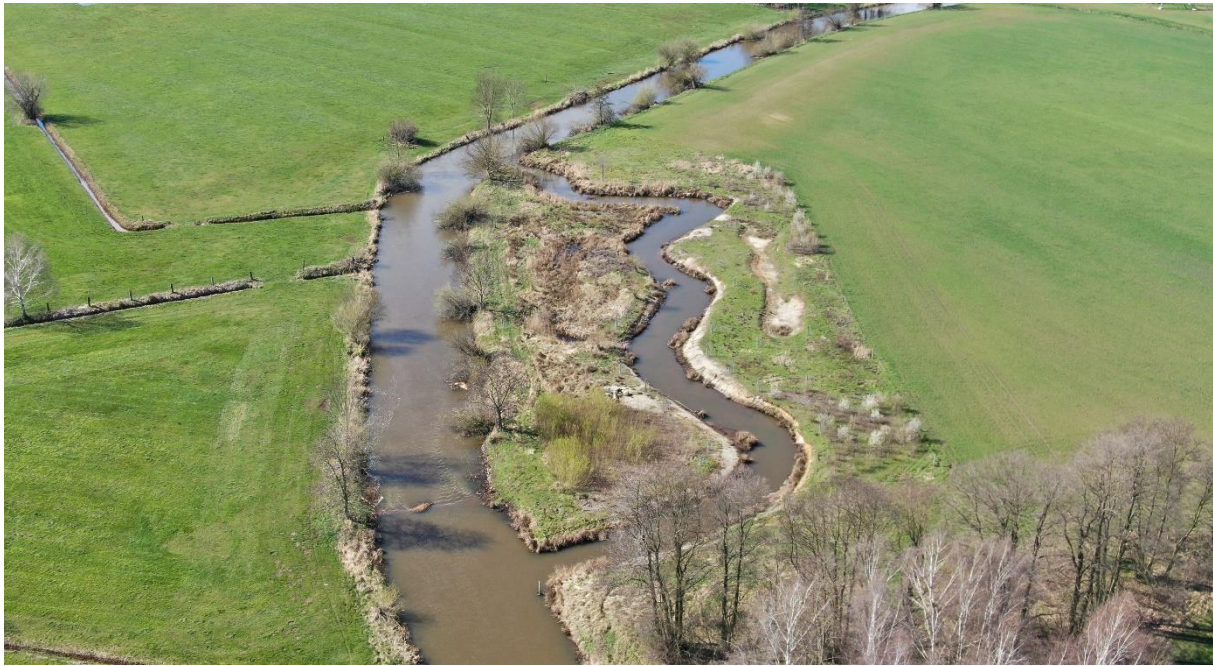
Elsterwiesenschleife – drei Jahre nach Fertigstellung