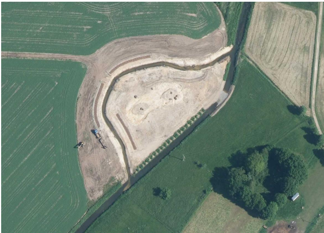
Blick von oben auf die Klosterschleife kurz vor Fertigstellung (2014)

Als Besonderheit in diesem Flächenpool konnte die Wiederherstellung von fünf Flussschleifen am Unterlauf realisiert werden.