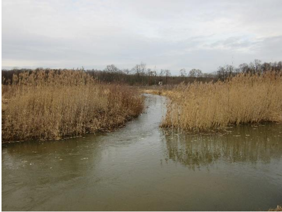
Klosterschleife bei Hochwasser (Auslauf) 2016