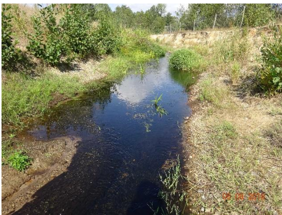
Klosterschleife bei Niedrigwasser 2018