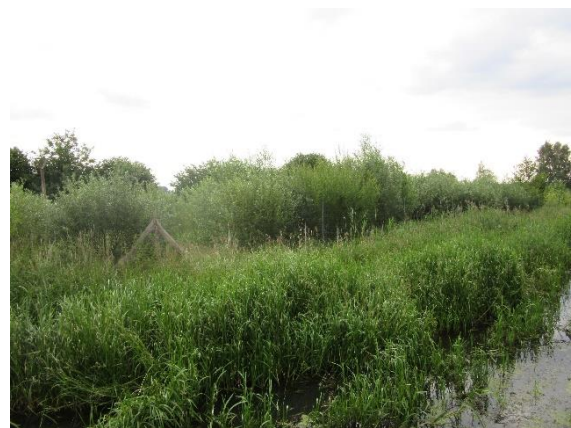
Auwaldpflanzung Lindenaer Mühle