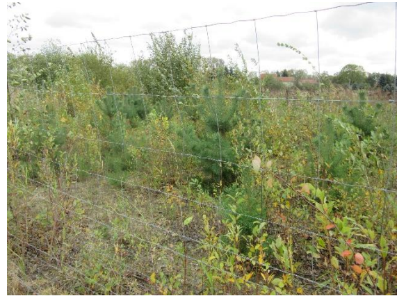
Sukzession nach Oberbodenabtrag und Zäunung