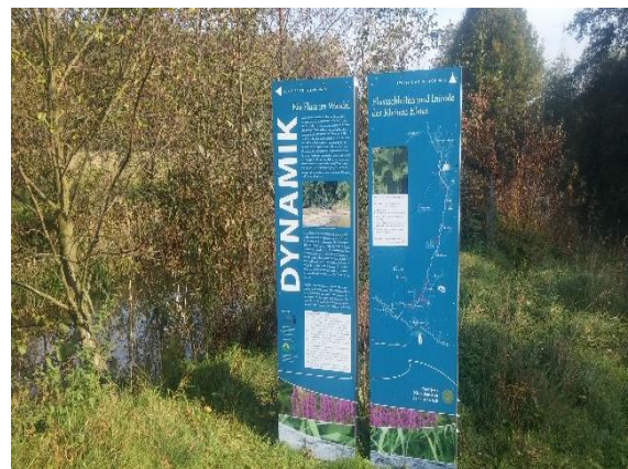
Beschilderung durch den Naturpark und Naturwacht

Weiterführende Informationen können Sie bei Bedarf unter unten angegebener Adresse erhalten.