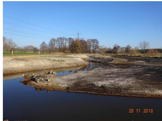
Elsterwiesenschleife kurz nach Fertigstellung 2018