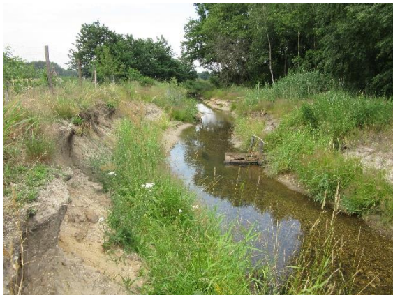
Die Waldschleife ein Jahr nach Fertigstellung