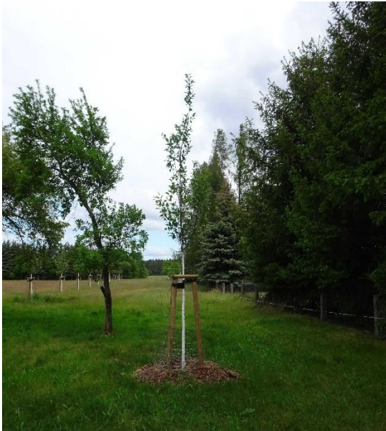
Blick auf die Streuobstwiese