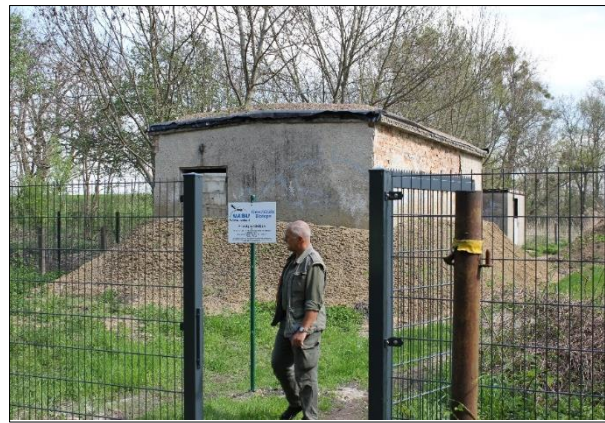
Abb. 2 Außenansicht zur naturschutzfachlichen Abnahme am 06.05.2013