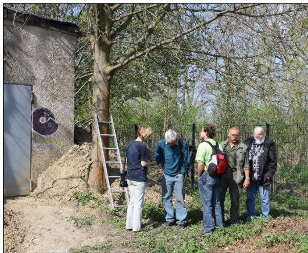
Abb. 3 Naturschutzfachliche Abnahme 06.05.2013