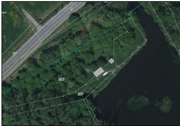
Abb. 1: Übersichtskarte/ Luftbild Fledermausquartier Bredower Rübenhafen.