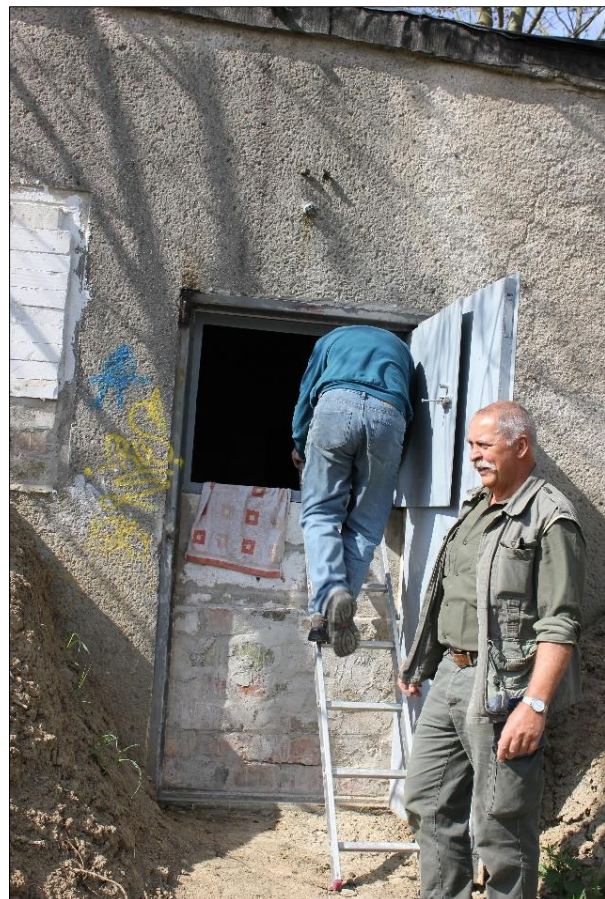
Abb. 5 Naturschutzfachliche Abnahme 06.05.2013