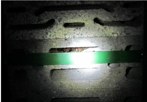
Abb. 6 Nachweis von Fledermäusen am 12.09.2013