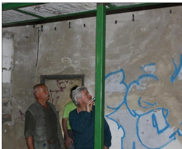
Abb. 4 Naturschutzfachliche Abnahme 06.05.2013