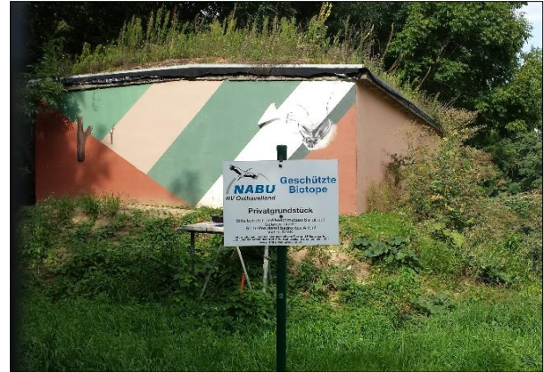
Abb. 7: Außenansicht 1 21.08.2014