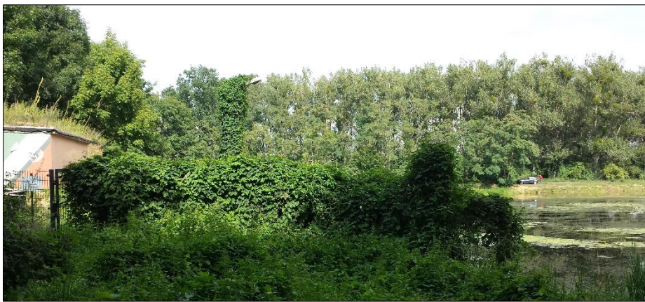
Abb. 8: Außenansicht 2 21.08.2014

Weiterführende Informationen können Sie bei Bedarf unter unten angegebener Adresse erhalten.