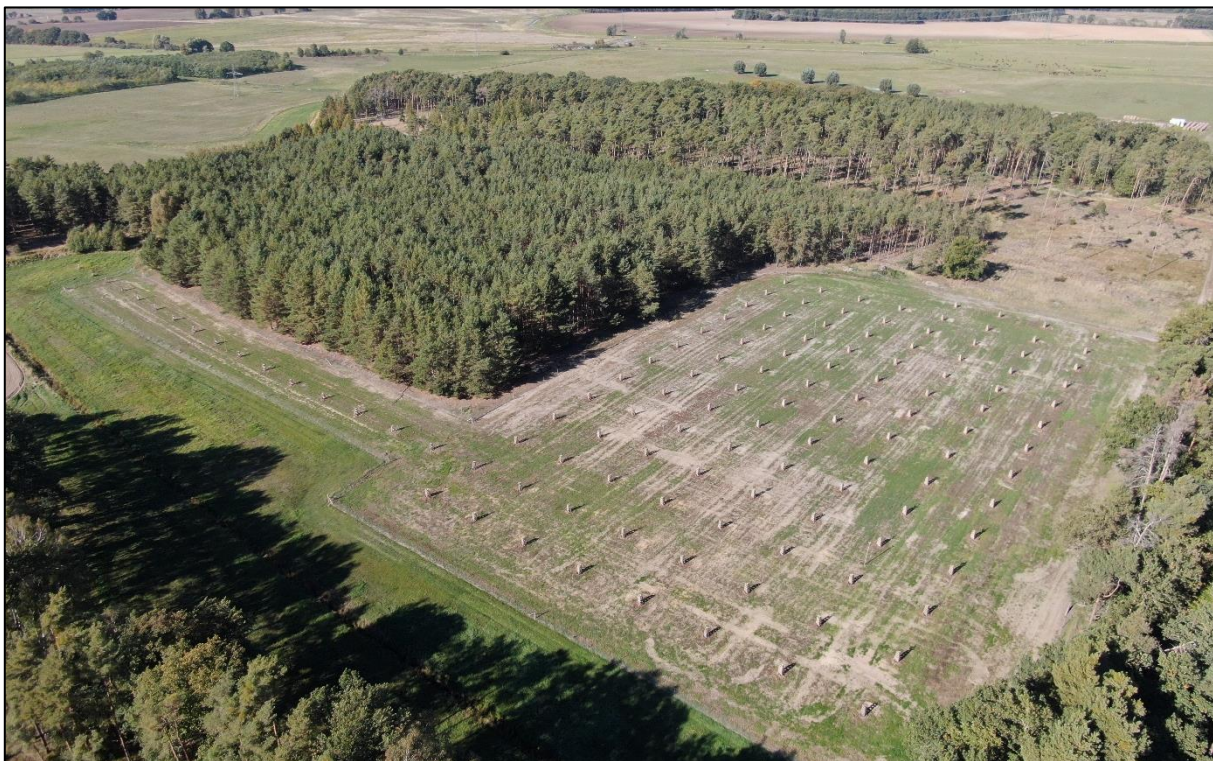
Streuobstwiese Jerchel, Oktober 2022

In Jerchel soll die Maßnahme der Landschaftsgestaltung dienen. Die Streuobstwiese sowie die Hecke wurden im Frühjahr 2022 gepflanzt und über einen Grundbucheintrag dauerhaft gesichert. Auch hier kommen vorwiegend alte und regional verwendete Apfel-, Birnen- und Pflaumensorten zum Einsatz.