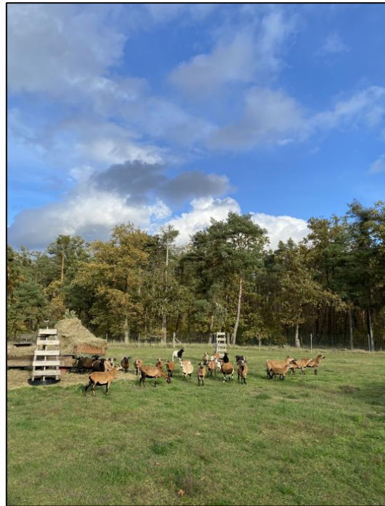
Streuobstwiese Jerchel November 2023

Weiterführende Informationen können Sie bei Bedarf unter unten angegebener Adresse erhalten.