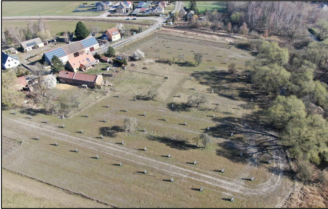
Streuobstwiese Pritzerbe, Luft März 2022

In Jerchel soll die Maßnahme der Landschaftsgestaltung dienen. Die Streuobstwiese sowie die Hecke wurden im Frühjahr 2022 gepflanzt und über einen Grundbucheintrag dauerhaft gesichert. Auch hier kommen vorwiegend alte und regional verwendete Apfel-, Birnen- und Pflaumensorten zum Einsatz.