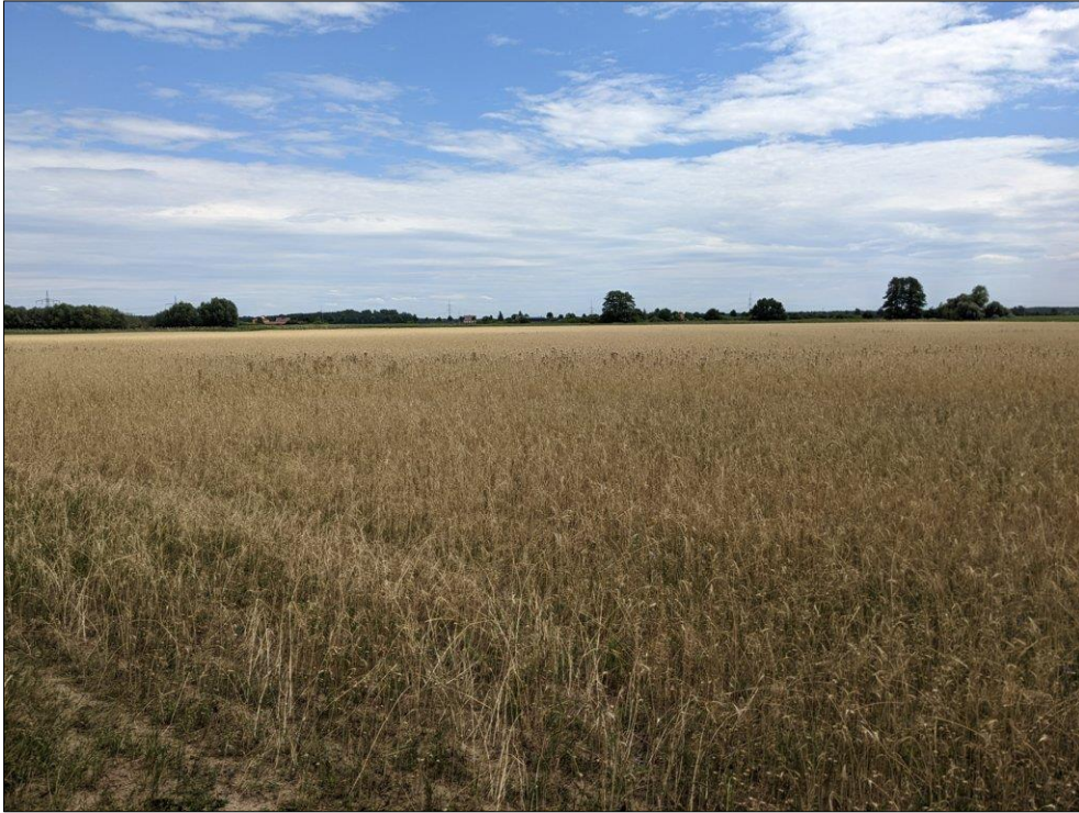
Abb. 1: Ausgangszustand als Acker im Sommer 2022