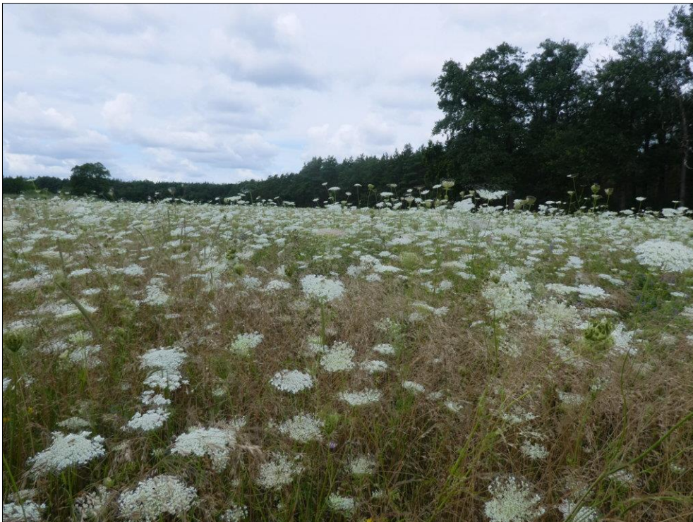
Abb. 2: Starkes Aufkommen von Wilder Möhre nach Aufgabe der Ackernutzung im Sommer 2023

Weiterführende Informationen können Sie bei Bedarf unter unten angegebener Adresse erhalten.