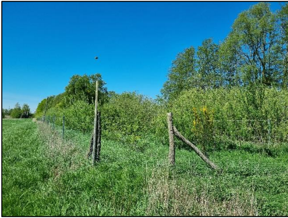
Abb. 7 Heckenkorridor in Dyrotz-Luch I; Stand 05/2023.