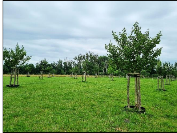
Abb. 4 Streuobstwiese in Bredow; Stand 10/2023.