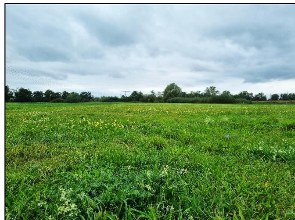
Abb. 6 Extensivgrünland in Dyrotz-Luch I; Stand 10/2023.