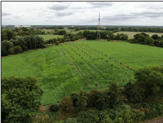
Abb. 3 Streuobstwiese in Bredow; Stand 09/2022.