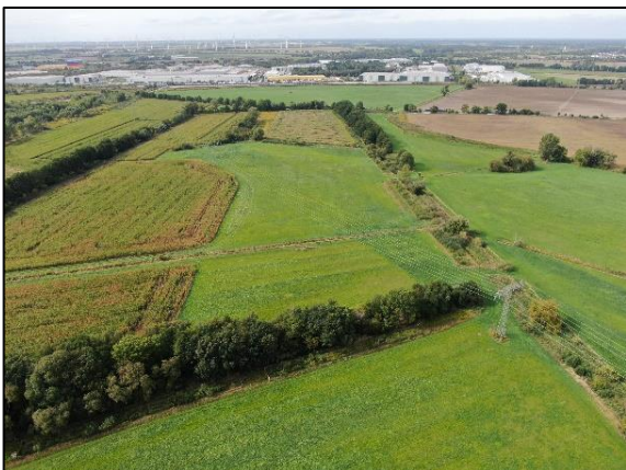
Abb. 5 Extensivgrünland und Gehölzpflanzungen Dyrotz-Luch I; Stand 09/2022.