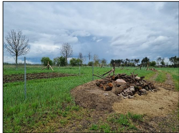
Abb. 10 Fertiggestellte Habitatelemente für Zauneidechsen Dyrotz II; Stand 04/2024.

Weiterführende Informationen erhalten Sie bei Bedarf unter unten angegebener Adresse.