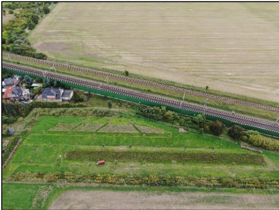
Abb. 1 Streuobstwiese und Heckenpflanzung in Wernitz; Stand 09/2022.