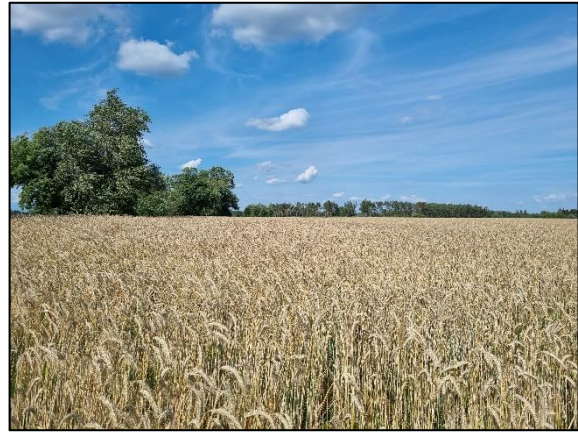
Abb. 8 Ausgangszustand Intensivacker Dyrotz II; Stand 07/2023.