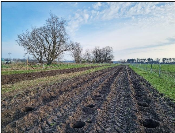
Abb. 9 Pflanzvorbereitung Dyrotz II; Stand 03/2024.