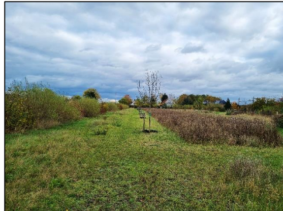
Abb. 2 Streuobstwiese mit Altgrasstreifen und Heckenpflanzung in Wernitz; Stand 11/2023.