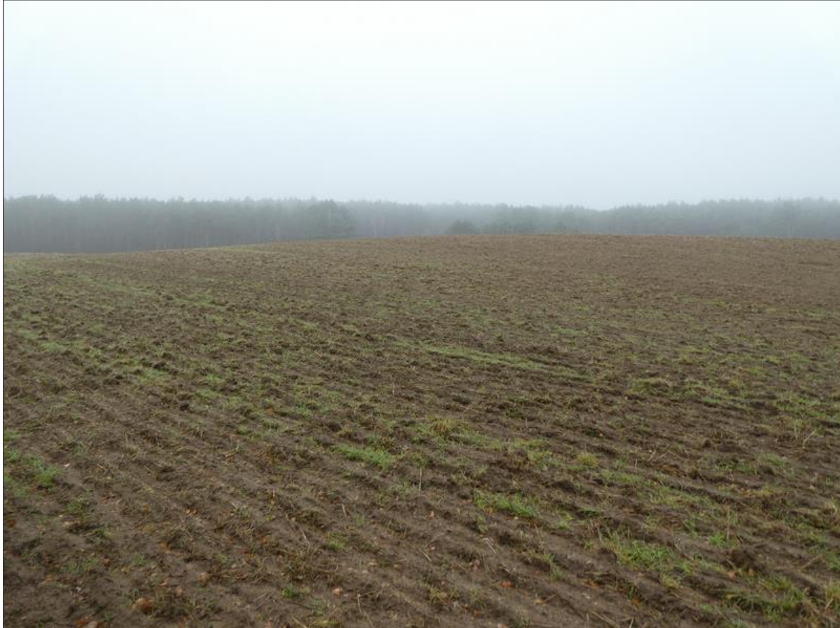
Abb. 1: Ausgangszustand im Dezember 2019

An den Rändern der Grünlandfläche, einem darüben verlaufenden Weg sowie an den bislang strukturarmen Übergängen vom Wald in das Offenland werden im nächsten Realisierungsschritt Hecken und Gehölze gepflanzt.