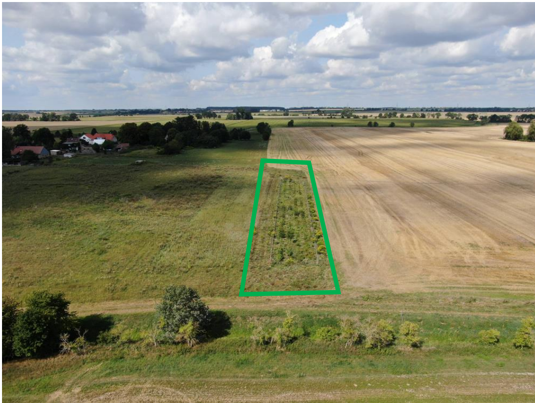
Abb. 1: Hecke Charlottenhof aus der Luft im Sommer 2019, Foto: T. Clausing, Flächenagentur Brandenburg GmbH