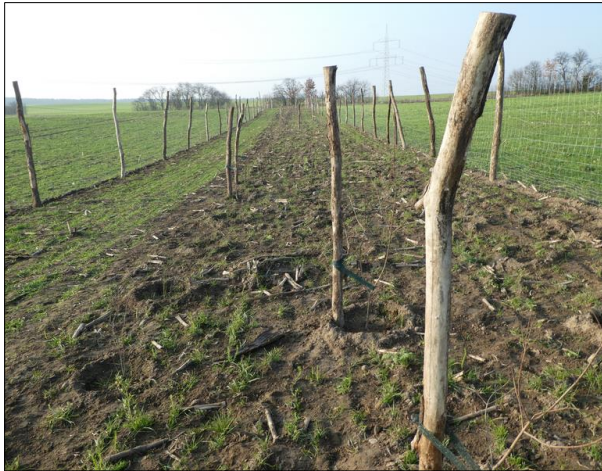
Abb. 1: Hecke in Jänickendorf unmittelbar nach der Pflanzung im Dezember 2020

In Neuendorf waren 2021, bei grundsätzlich gutem Anwuchs, ein paar Probleme auf dem trockenen Standort neben der großen Ackerfläche zu verzeichnen. In Jänickendorf sind fast alle Pflanzen gut durch das erste Jahr gekommen.