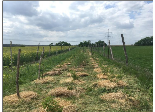
Abb. 2: Gut angewachsene Pflanzen im Mai 2022

Weiterführende Informationen können Sie bei Bedarf unter unten angegebener Adresse erhalten.