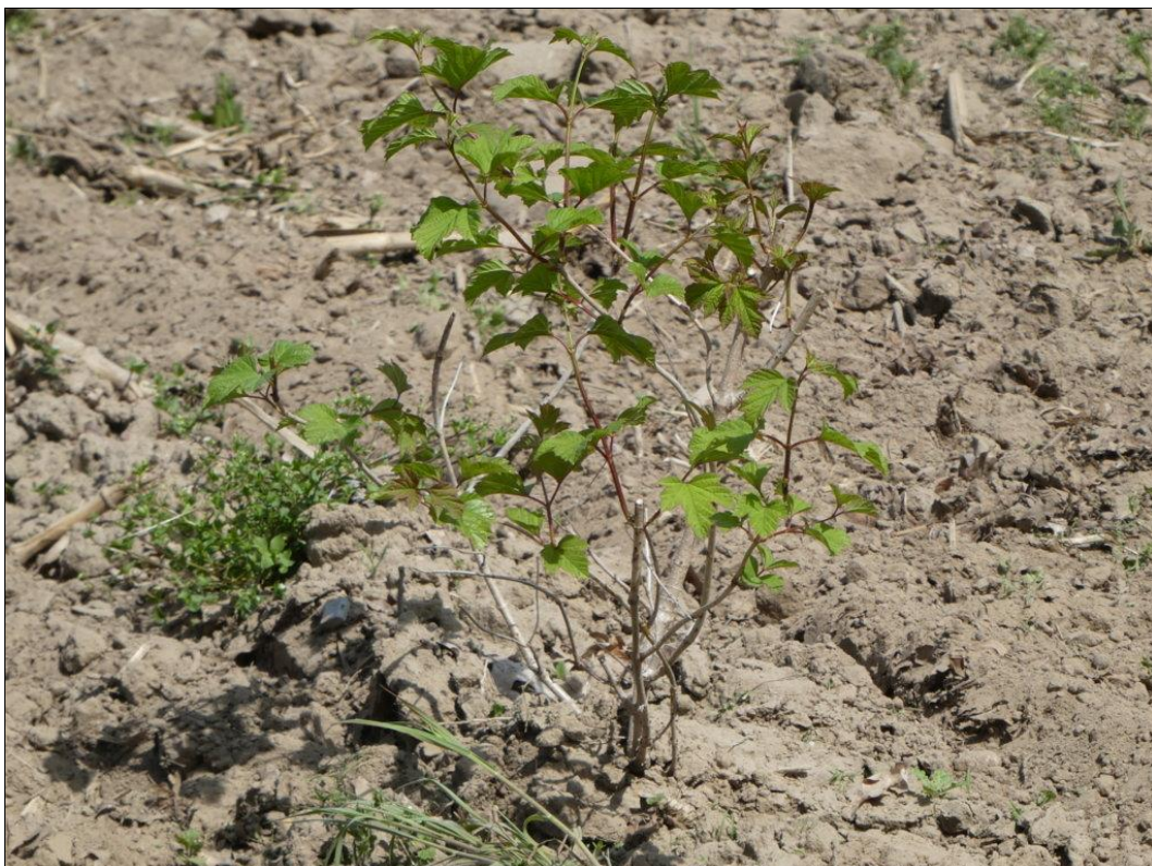
Abb. 3: Detail (Feldahorn) einer frischen Heckenpflanzung im Mai 2022

Weiterführende Informationen können Sie bei Bedarf unter unten angegebener Adresse erhalten.