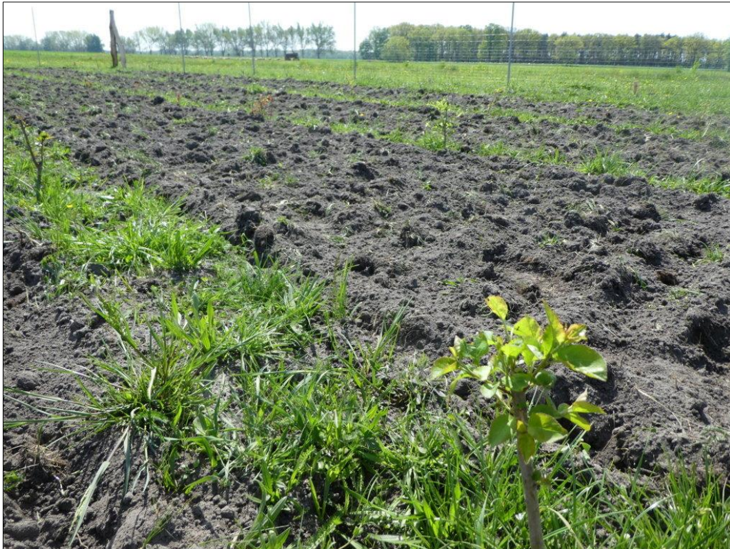
Abb. 2: Frische Heckenpflanzung im Mai 2022