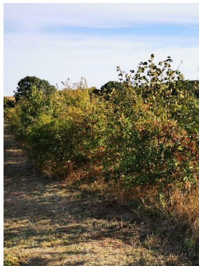
Abb.6: Hecke 06.09.2022