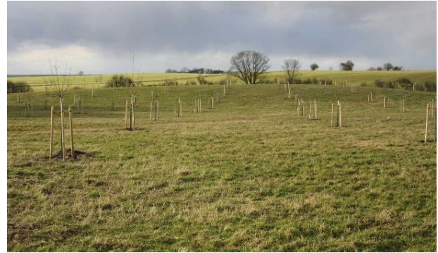
Abb. 2: Pflanzreihen Feb. 2016