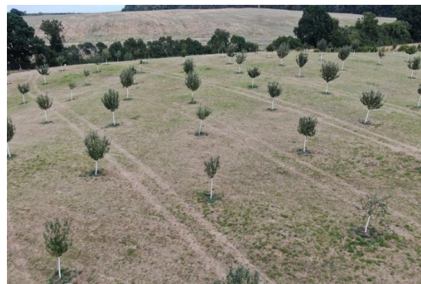
Abb. 4: Luftbild nach Mahd vom 26.07.22