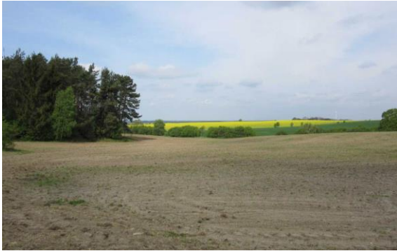
Abb. 1: Ausgangszustand 2015 Richtung Norden