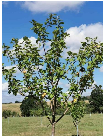
Abb. 5: Abnahme am 25.08.20