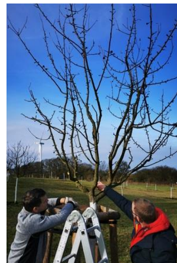
Abb.7: Schittberatung am 22.2.23

Weiterführende Informationen können Sie bei Bedarf unter unten angegebener Adresse erhalten.