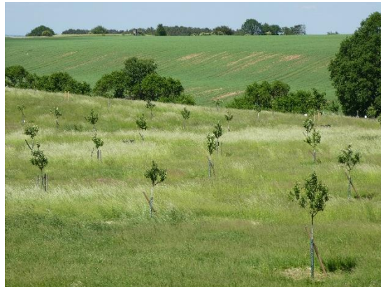
Abb. 3: Streuobstfläche Mai 2018