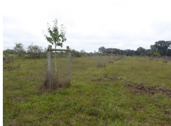
Abbildung 5: Streuobstwiese im Oktober 2023

Weiterführende Informationen können Sie bei Bedarf unter unten angegebener Adresse erhalten.