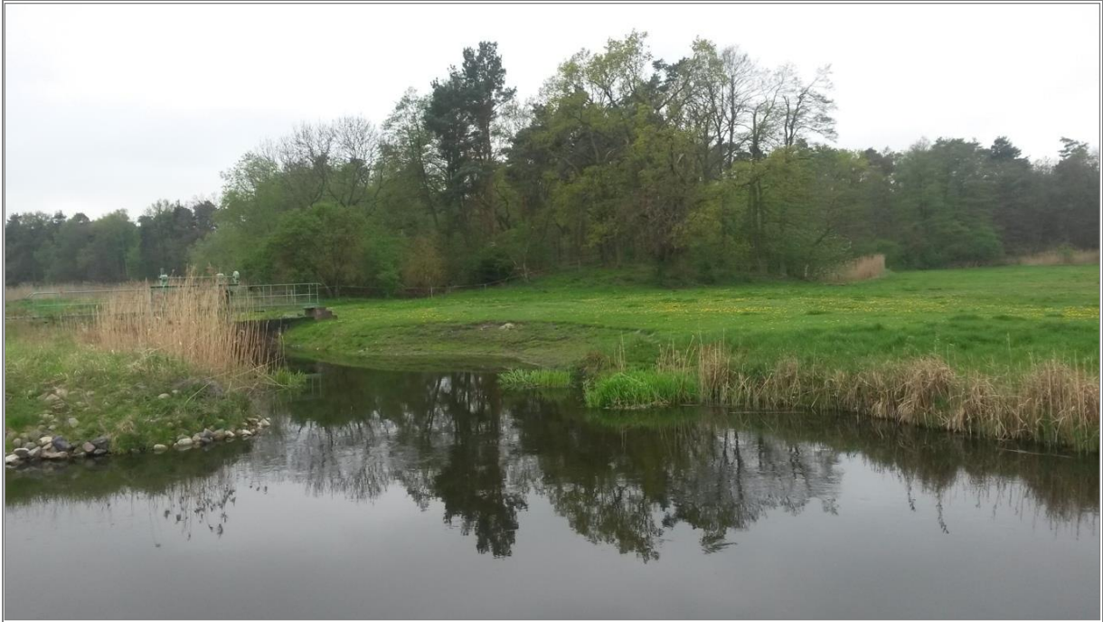
Abb. 1: Einmündung des neu angeschlossenen Altarms vor dem Wehr