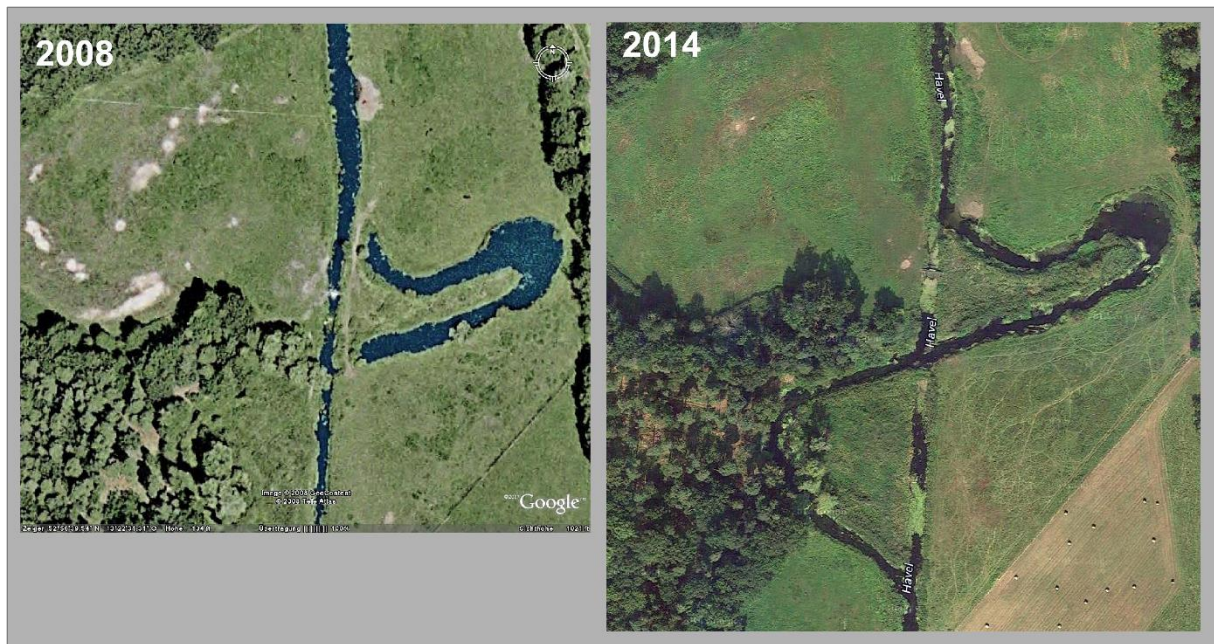
Abb. 3: Strukturverbesserung durch die Maßnahme im Luftbildvergleich 2008 gegenüber 2014.