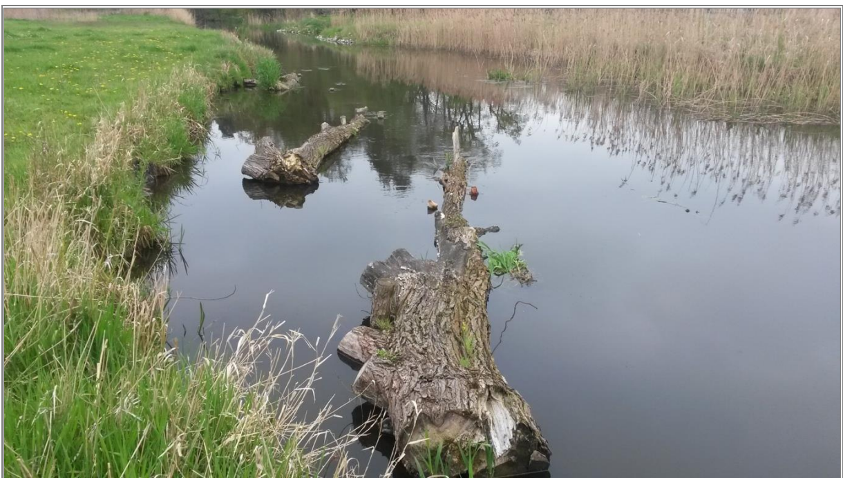
Abb. 2: Totholz als Strömunglenker

Die Maßnahme wurde bis zum Frühjahr 2013 komplett umgesetzt, die Bauabnahme hat stattgefunden.