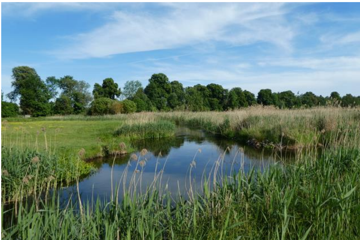
Abb. 4: Einmündungsbereich der neuen Gewässerschleife im Mai 2018. (Alle Fotos außer den Luftbildern: Martin Szaramowicz)

Weiterführende Informationen können Sie bei Bedarf unter unten angegebener Adresse erhalten.