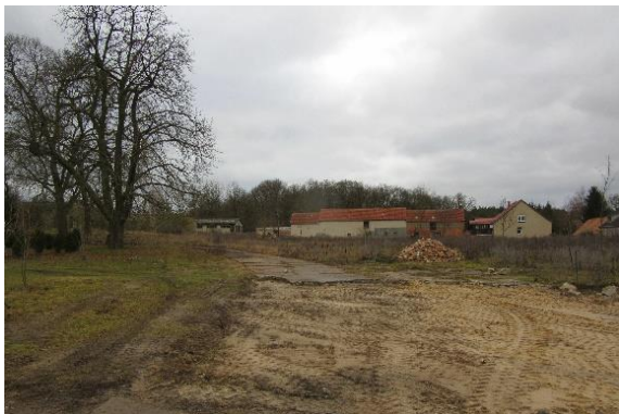
Abb. 1: östliche Seite