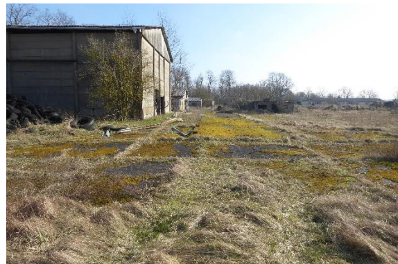
Abb. 2: Scheune westliche Seite