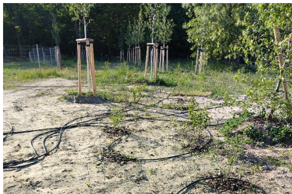
Abb.3: Nach der Pflanzung im Frühjahr 2023

Weiterführende Informationen können Sie bei Bedarf unter unten angegebener Adresse erhalten.