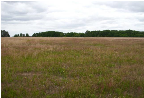
Abb. 1: Trockene Grünlandfläche