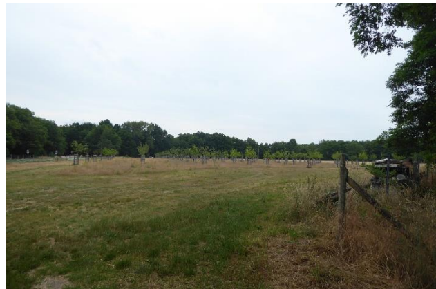
Abb.2: Streuobstwiese im Juni 2021