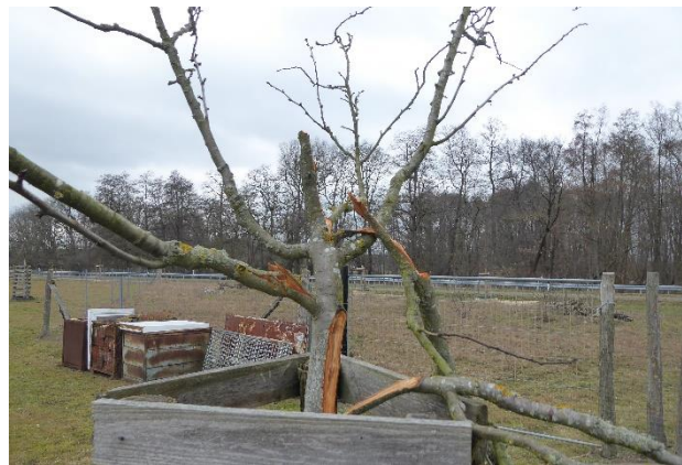
Abb.4: Vandalismusschäden Februar 2023

Weiterführende Informationen können Sie bei Bedarf unter unten angegebener Adresse erhalten.