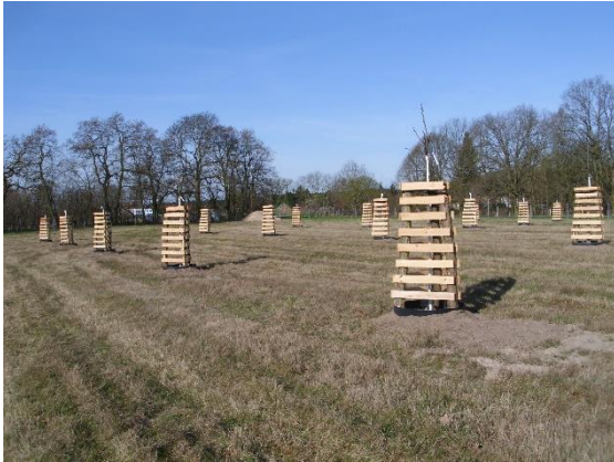
Abb. 1: Nach der Pflanzung 2014 - Blick zum Ort