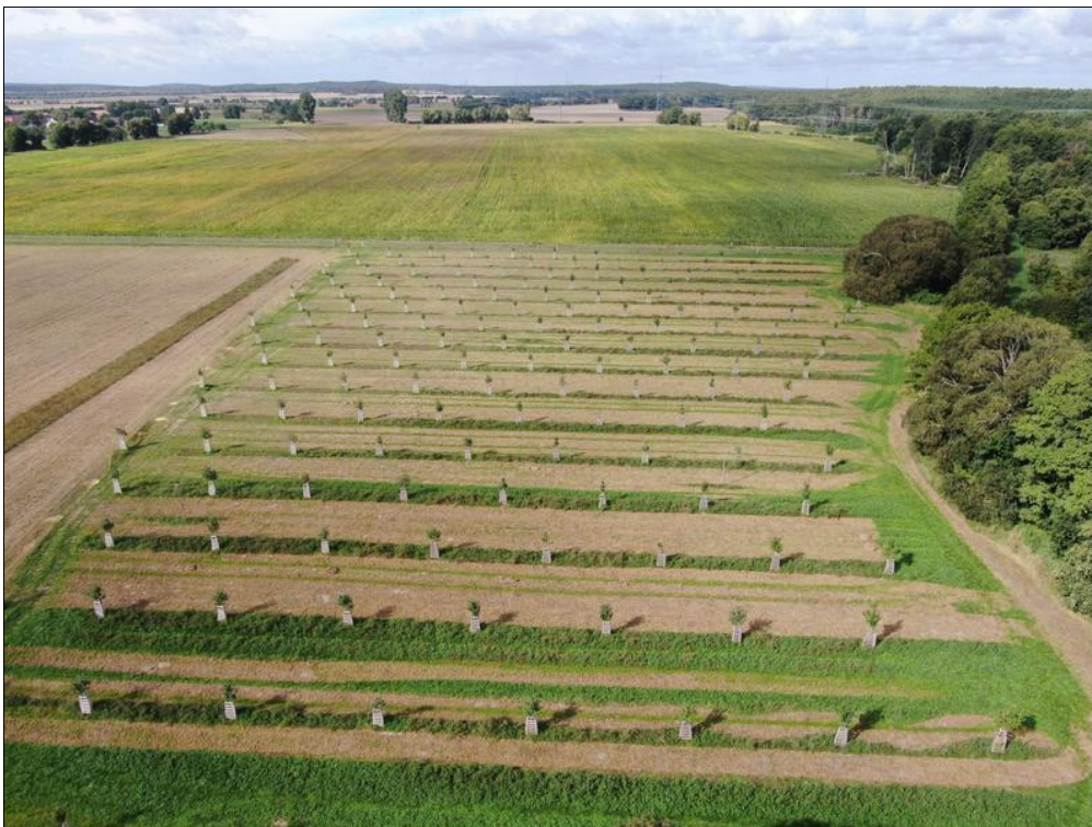
Abb. 6: Streuobstwiese aus der Luft im September 2022