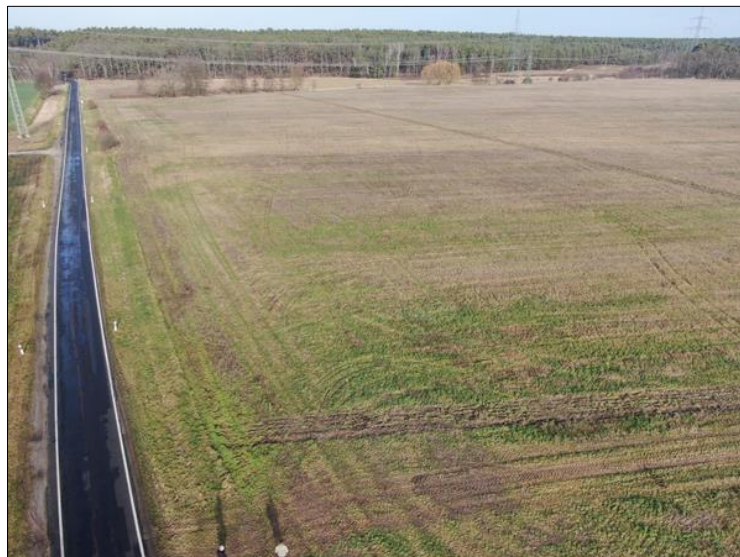
Abb. 2: Zustand der Ackerflächen im Westen des Pools an der Straße vor Maßnahmendurchführung

Weiterführende Informationen können Sie bei Bedarf unter unten angegebener Adresse erhalten.