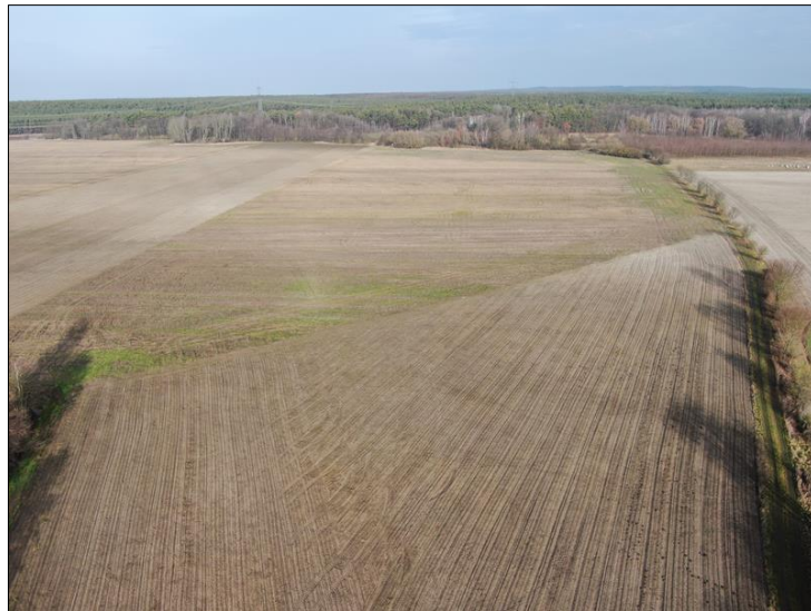
Abb. 1: Zustand der großen, unstrukturierten Ackerfläche im Osten des Pools vor Maßnahmendurchführung

Zwei im Eigentum der Flächenagentur stehende Flächen werden künftig als Ackerflächen des Bio-Betriebes genutzt. Diese gehören zwar nicht zur vermittelbaren Flächenkulisse, tragen aber durch die dort stattfindenden Fruchtfolgen und Anbau-Methoden zur naturschutzfachlichen Wirksamkeit des Gesamtpakets in diesem Pool bei.