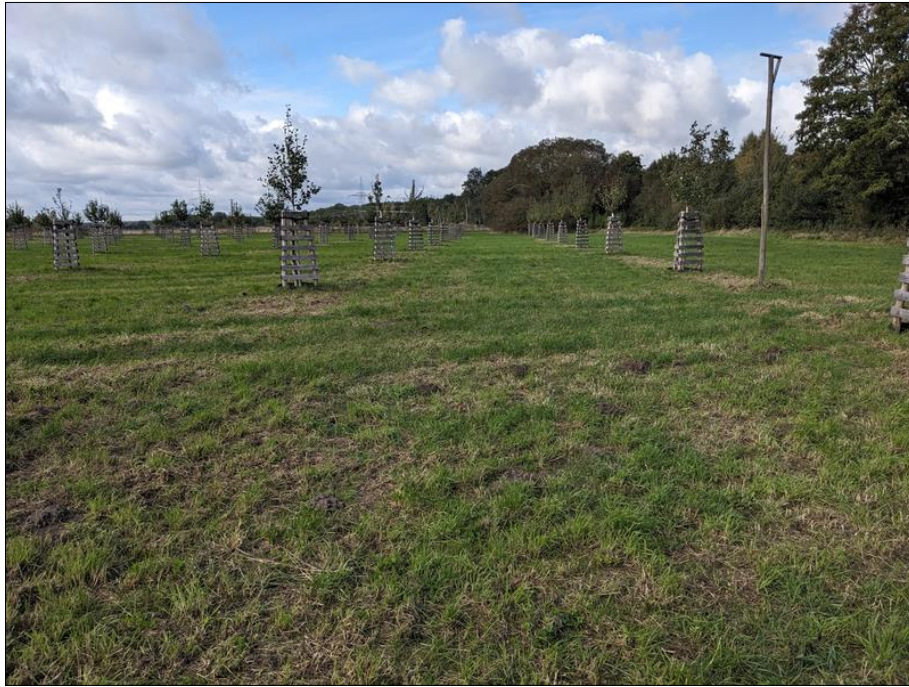
Abb. 3: Eindruck der Streuobstwiese im Herbst 2023

Im Jahr 2021 wurden die Poolmaßnahmen vollständig durch die Pflanzung der Obstbäume auf der Streuobstwiese, die Pflanzung der Hecken und die Einsaat von Regiosaat auf den künftigen Grünlandflächen umgesetzt. Im Bereich der Streuobstwiese wurde auf die Einsaat von Regiosaatgut zunächst verzichtet und die Vegetationsentwicklung unter den Bäumen beobachtet.