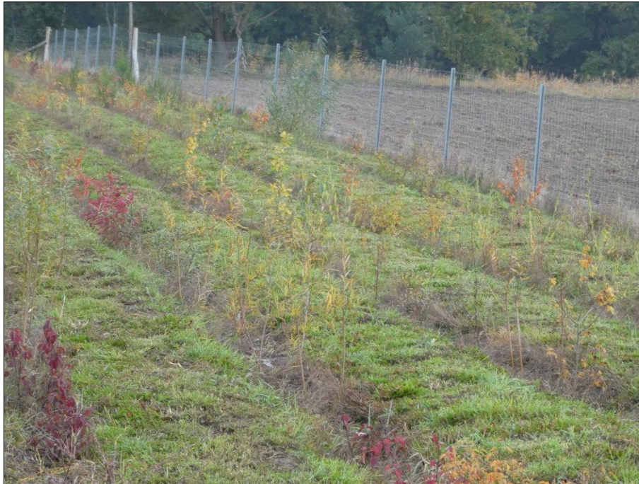
Abb. 5: Eine der der im Winter 2020/2021 gepflanzten Hecken im Oktober 2021