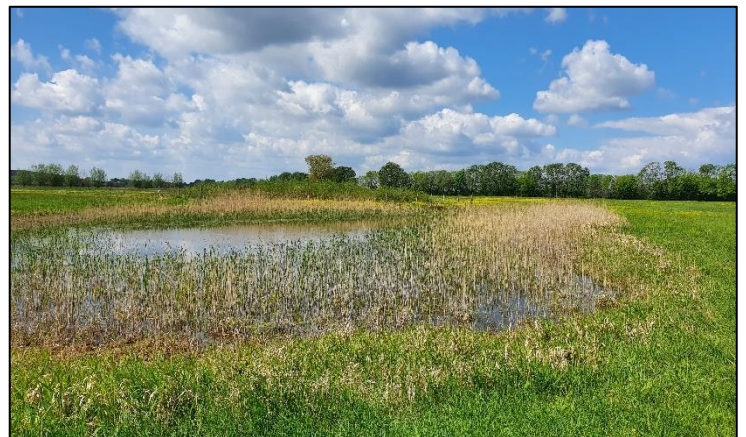
Abb. 4 Senken

Ab Januar 2013 wurde eine weitere Maßnahmefläche mit ca. 39 ha eingerichtet, die neben der Umwandlung von Intensivacker in extensiv genutztes Grünland auch die Einrichtung von Senken und Randstreifen (Hecken und Gehölzinseln) beinhalten wird. Zur Einrichtung des Grünlandes wurde zum Teil autochtones Saatgut verwendet.