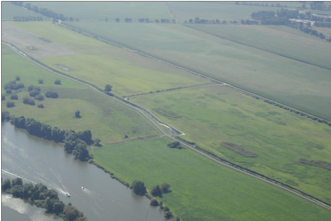
Abb. 1: Luftbild Pool Schmergow, 1. Bauabschnitt

Auf den Flächen erfolgt eine extensive Grünlandnutzung. Gleichzeitig haben die Gebiete durch die Anlage von Senken sowie durch Pflanzmaßnahmen entlang der Wege und Gräben eine größere Strukturvielfalt erhalten.