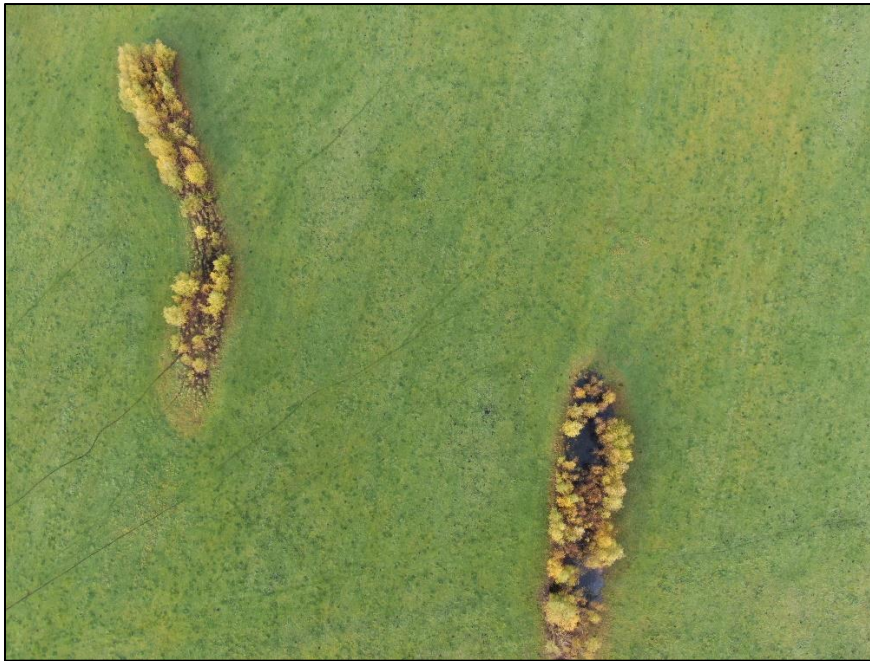
Abb. 2: Luftbild Pool Schmergow, 2. Bauabschnitt, Senken