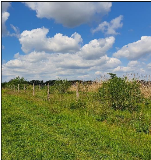
Abb. 3 Pflanzung