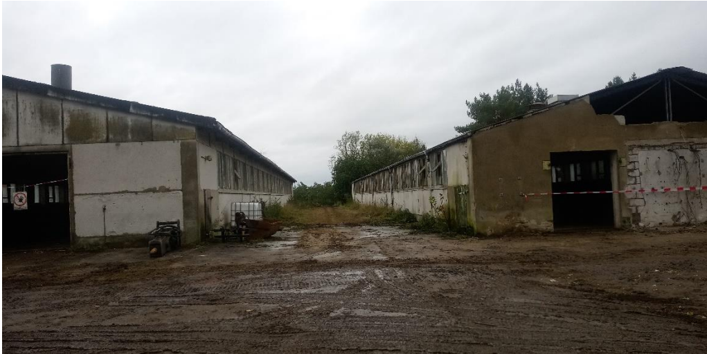
Zwei der Ställe aus den 70iger Jahren