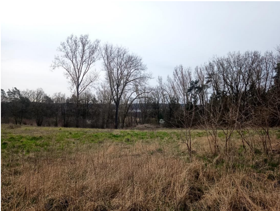
Blick zum Rambower Moor von der entsiegelten Fläche

Weiterführende Informationen können Sie bei Bedarf unter unten angegebener Adresse erhalten.