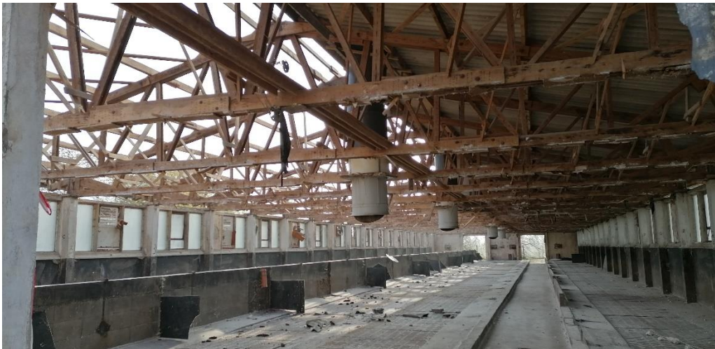
Rückbau einer der Ställe