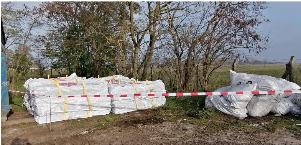
Zwischenlagerung der Asbestplatten