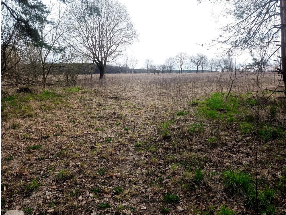
Ein Jahr später