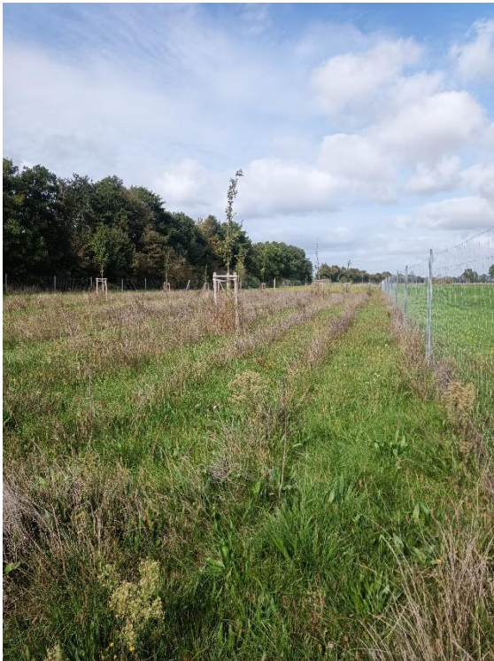
Heckenpflanzung mit Hochstämmen