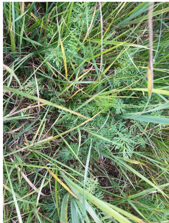
Stromtalwiesen mit Brennolden