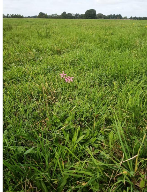
Artenreiche Feuchtwiesen (blühend Kuckucks-Lichtnelke)