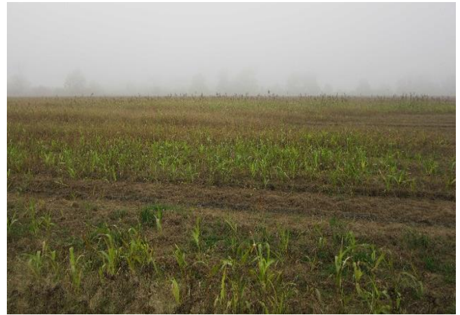
Ackerfläche vor der Ersteinrichtung ...