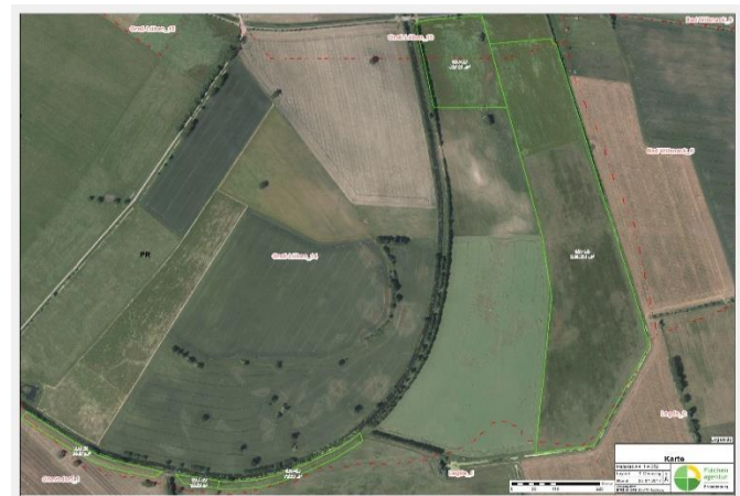
Ca. 24 ha große Maßnahmenfläche am Karthaneknie vor der Umsetzung