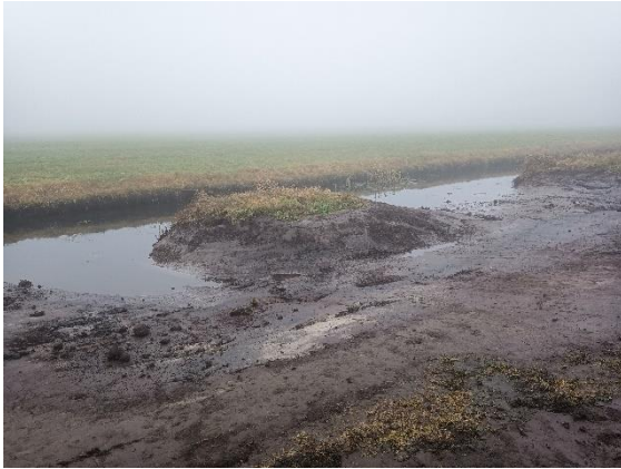
Uferabflachung am Graben