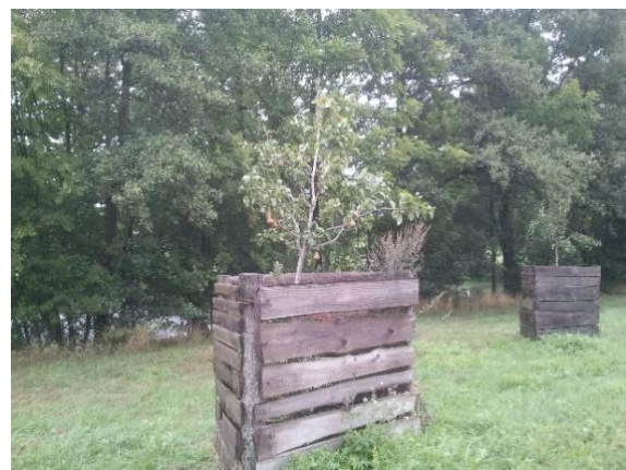
Kleine Streuobstwiese an der Ortslage Gandow