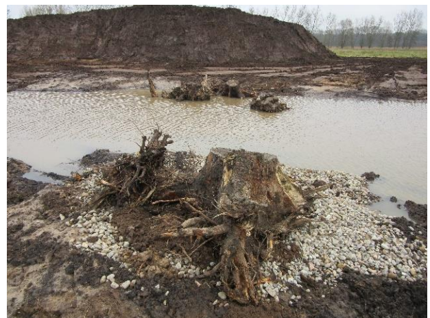
Amphibiengewässer bei Eldenburg kurz nach der Fertigstellung im Dezember 2016