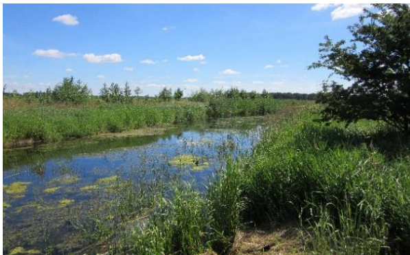
Sechs Jahre nach der Pflanzung