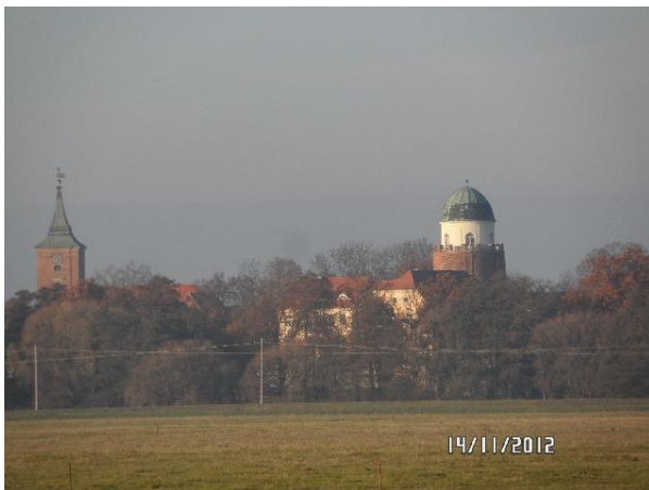
Blick von der Löcknitz auf die Burg Lenzen