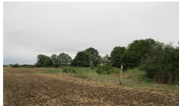
Extensivierung einer direkt an die Löcknitz angrenzenden Ackerfläche; Abgrenzung durch Eichenpfähle