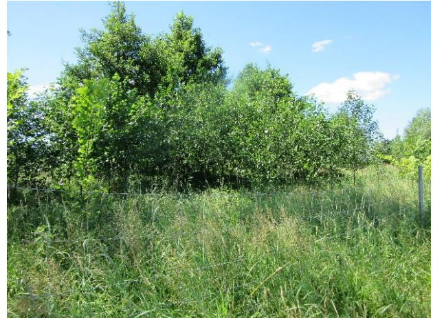
Ufergehölzpflanzung ca. 10 Jahre nach Pflanzung