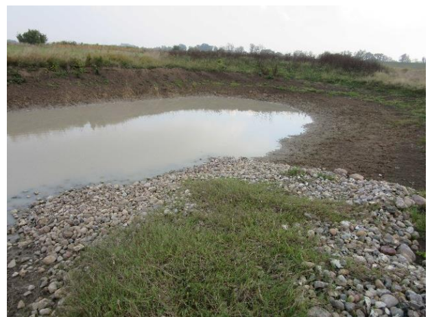
und im Qualmwasserbereich Lütkenwisch aus Januar 2016

Weiterführende Informationen können Sie bei Bedarf unter unten angegebener Adresse erhalten.