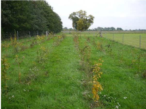
Ufergehölzpflanzungen nach 2 Jahren