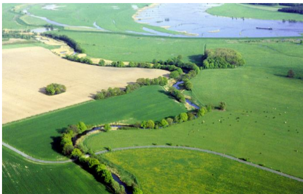
Die Löcknitz von oben