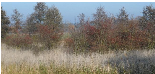
Leitbild für Uferrandstreifenbepflanzung – Gehölzsukzession am Wehr Gandow