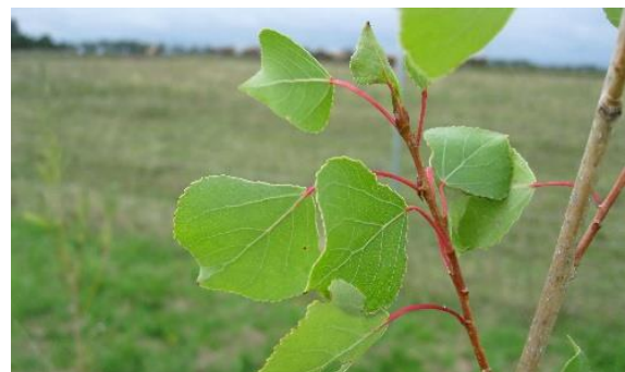
Schwarzpappeln gehören in die großen Flusstäler