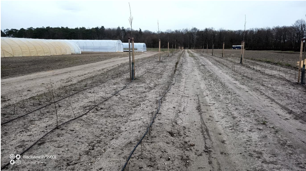
Kurz nach der Pflanzung: Hochstamm-Allee und Heckenstruktur