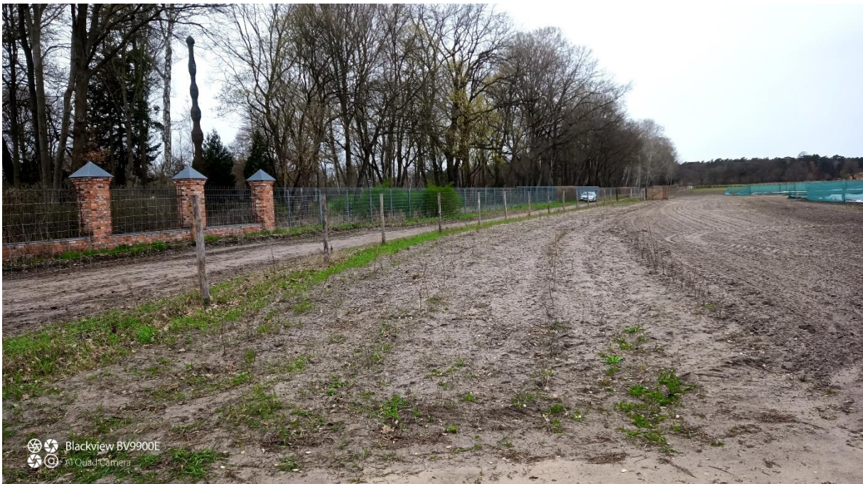
Kurz nach der Pflanzung: Heckenpflanzung mit Pufferstreifen, der mit Regio-Saatgut eingesät wurde