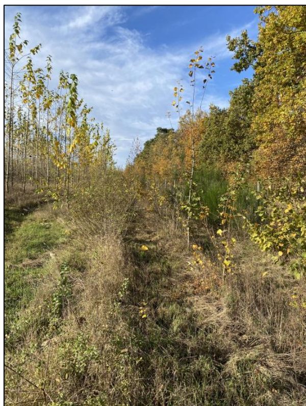
Heckenpflanzung im November 2023