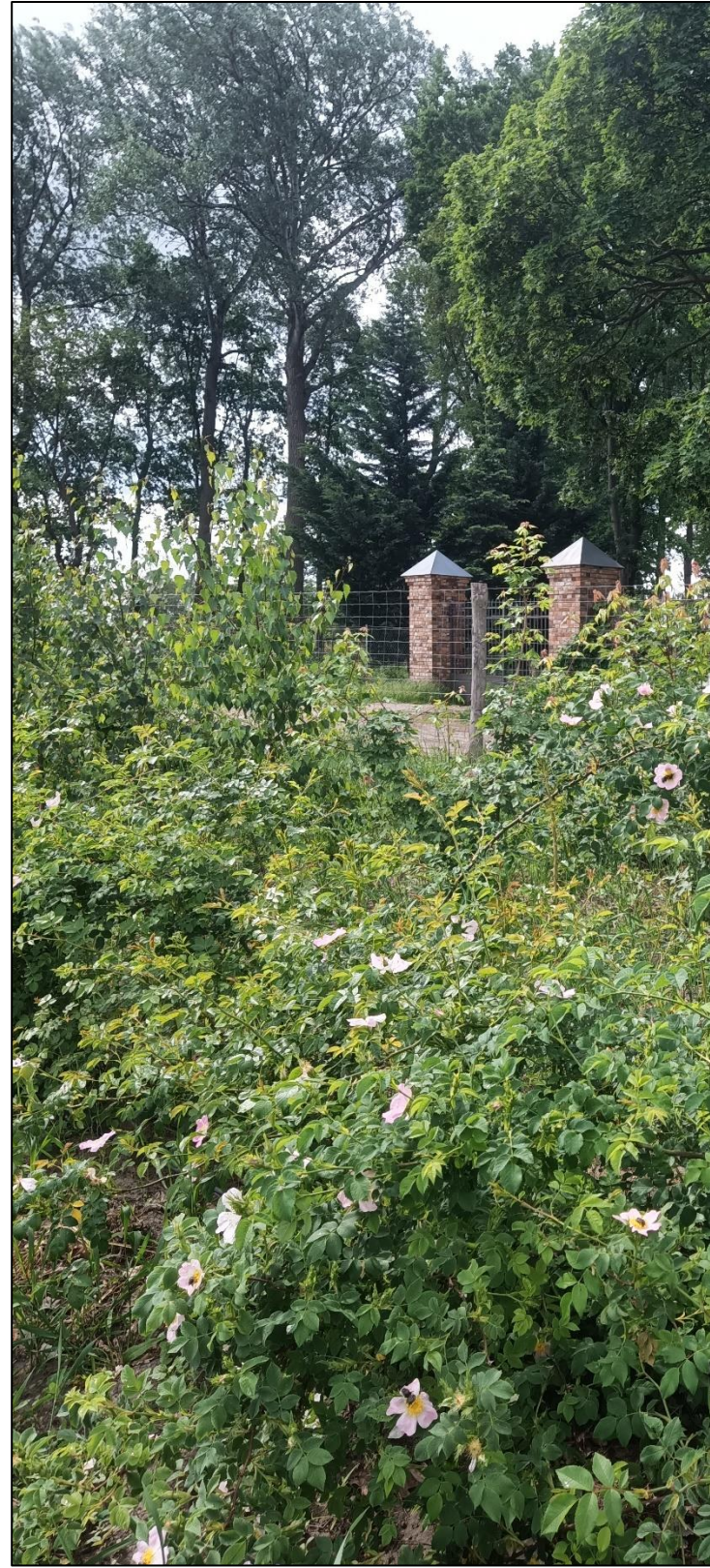
Heckenpflanzung im Mai 2022