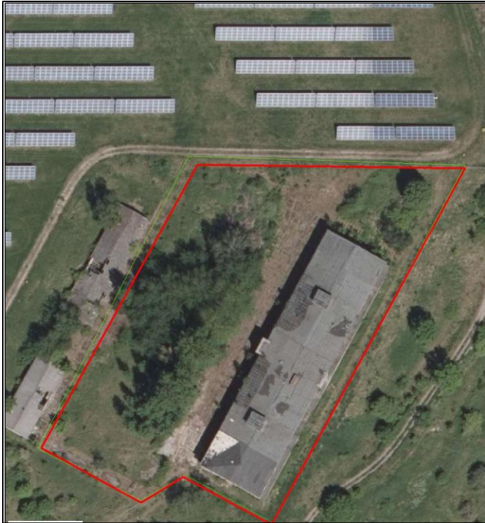
Übersichtskarte/ Luftbild Fledermausquartier Prenzlau